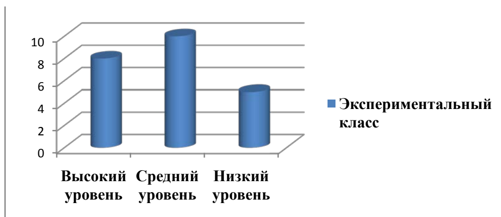
Диаграмма 1. Итоговый результат экспериментальной работы по формированию творческих способностей младших школьников на уроках искусства и технологии

В качестве базовой школы для проведения эксперимента мы выбрали школу №15 города Худжанда, в которой сформировали группу в составе 25 учеников четвертого года обучения.