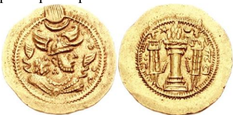
рис.8 рис.9 рис. 10 рис.11