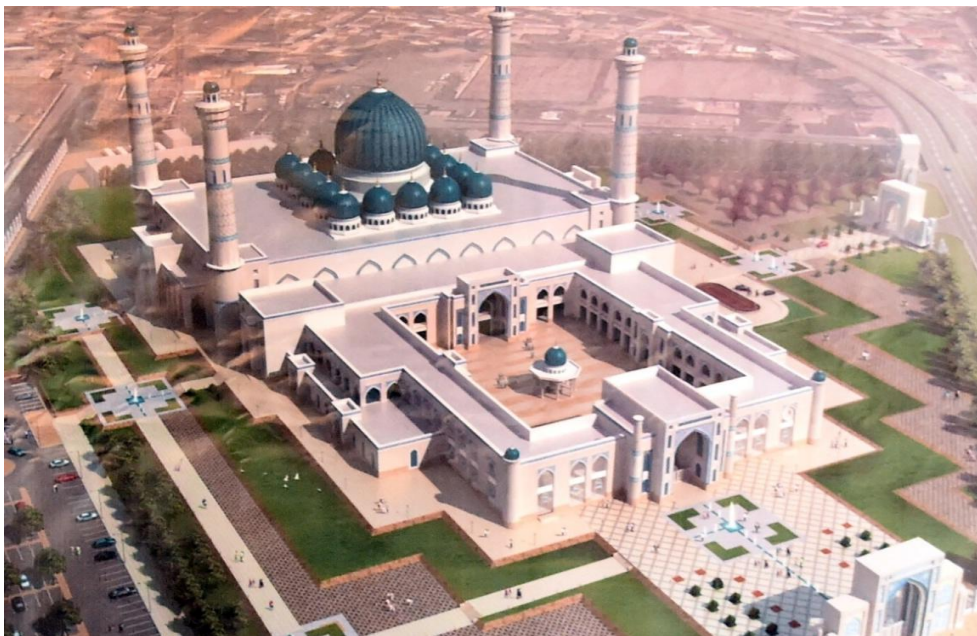
Рис. 2. Проект строительства здания Исламского университета в Душанбе

Мечеть состоит из 4 величественных минаретов высотой в 65 метров, купола 47 метров. В отличие от традиционных мечетей новая соборная мечеть является целым архитектурным ансамблем и современным духовно культурным комплексом, который кроме молитвенных залов охватывает также конференц-зал, учебные аудитории, музей, библиотеку, современную подземную автостоянку, галереи, парк и т.д. При проектировании данной мечети использованы традиционные элементы таджикского национального зодчества и архитектуры [9, с. 53].