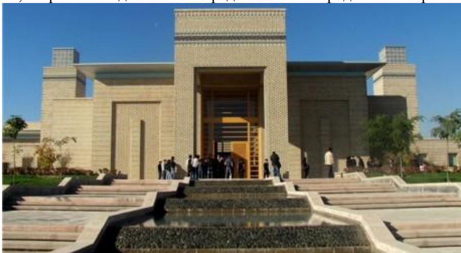
Рис. 1. Центр Исмаилитов в Таджикистане

Необходимо отметить, что особенно заметны взаимодействие традиций и современности в строительной культуре в культовых постройках, мечетях, мавзолеях, объектах культуры. В отдельных общественных зданиях применяются художественное искусство строительной техники, творчество и достижения средневековых народных мастеров Таджикистана.