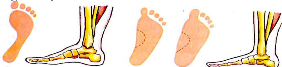
Рис.1. Стопа нормальная.Рис.2 .Стопа плоская (плоскостопие).

Нормальная стопа имеет форму полусвода (см. рис. 1). Слабость мышечно - связочного аппарата, его перегрузка, а также неправильная обувь, не соответствующая форме стопы, нарушают ее нормальные функции и могут привести к уплощению свода, плоскостопию (см. рис 2). Верное представление о строении стопы легко получить по ее отпечатку на полу, листе бумаги.