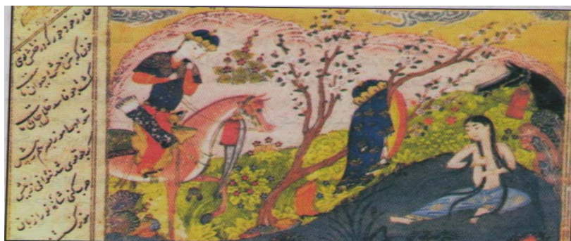
Тамашои маҳфиёна Хусрав аз обтани Ширин. Сабки Туркқамон, 1505 м.

в) Сабки Ҳирот: Хунари наққошии Эрон дар асри IX х.к. бо номи Ҳирот гирех хӯрдаст ва ба номи мактаби даврони Темурӣ шӯҳрат ёфтааст. Шохрух-фарзанди Темур, ки пеш аз фавти ӯ ҳукумати Хуросон, Сиистон, Рой ва Мозандаронро ёфта буд (779 х.к.), пас аз фавти Темур (807 х.к.) дар Ҳирот ба салтанат нишаст ва то соли 850 х.к. дар он ҷо ҳукумат ронд. Ӯ, агарчи дар ибтидо бо ҷангҳо ва сарпечҳои ҳокимон мувоҷеҳ буд, лекин саранҷом ҳукумати хешро дар тамоми Эрон ва Мовароунаҳр тасбит кард ва бо ободсозии Ҳирот ва бархе шаҳрҳои дигар фурсатро барои тавсияи хунари ва шукуфоии мактаби Ҳирот фароҳам овард. Нахустин тавлидоти мактаби дарбории Шохрух, таҳти таъсири мустақими сабки мутақаддими Темурӣ буд. Ва аз он ҷо, ки Ҳирот аз маркази кӯҳани хунари дур буд, ин осор аз улӯҳои (сармашқҳои) қабул аз Темурӣ маҳсусан Илхонӣ баҳра гирифтаанд.