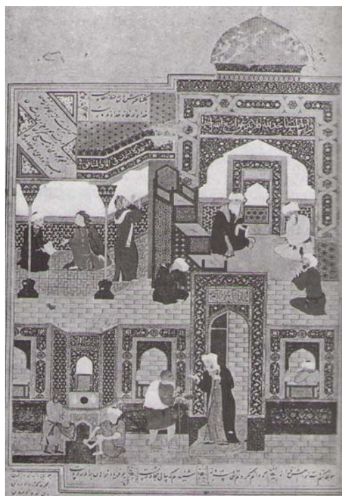
Ғадо бар дари масҷид Ҳирот, нусхаи «Бустон»-и Саъдӣ асари: Камолиддини Бeҳзод, 893 х.к.

Шеваи наққошӣ ва таҳаввуле, ки Бeҳзод дар нигоҳгарoии асри худ падида овард, дар осори наққошони ҳамасри ӯ ва шогирдонаш мисли Шайхзода ва Қосималӣ чеҳра кушод, бисёр таъсиргузор буд. Ин таъсиргузорӣ баъдҳо ба ҳузuri Бeҳзод дар канори наққошони мактаби Табрез, мисли Мир Мусавар, Мир Саидалӣ ва наққошони наслҳои баъд, мисли Муҳаммадӣ ва Ризо Аббосӣ идома ёфт.