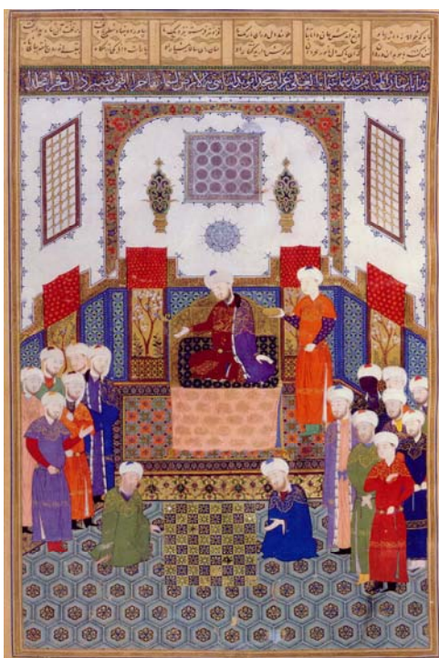
Фирисодани шаҳранҷ аз Ҳинд ба дарбори Анушервон ва кашфи рози он ба василаи Бузургмeҳр. «Шoҳнома»-и Бойсунғурӣ.

Машхуртарин наққошии ин давра, ки бисёре аз расмҳои гузаштaro дарҳам реҳт ва таъсири шадиде бар дигар хунармандон дошт, Камолиддин Бeҳзоди Ҳиротӣ буд. (соли 885 х.к./1480 м. то 936 х.к./1530м.). Бeҳзод ва шогирдони ӯ зимни рассомии пайкараҳо дар ҳолати мухталиф ва аз ҷиҳатҳои мутафовит, ба намоиши ҳолатҳо ва вижагиҳои фардии одамҳо низ тавачҷӯҳ кардаанд. Пайкараҳои осори Бeҳзод дорои ҳаёт ва машғули зиндагӣ дар фазои рӯзмарра ҳастанд. Тарзи рассомии суратҳо ба фардияти одамҳо наздик мешаванд ва эҳсосоти шахсӣ ба сурати зинда намоиш дода мешавад. Манзара ва меъмори дар осори Бeҳзод танҳо ба сурати як замина барои як рӯйдоди таърихӣ ё дoston тасвир намешавад, балки бо рафтор пайкараҳо ва соири мавзӯот таркиббанди пайванд меёбад. Фазои як даст ва саршоре аз ҳаракат ва зиндагии табииро ба вуҷуд меоварад. Рангомезии осори Бeҳзод бисёр усотодна ва мутанаввӣ аст ва таркибҳо бисёр ҳамоҳанг ва аҷзoi он, аз ҷумла, катибаҳо дар хидмати кулли асар мебошанд.